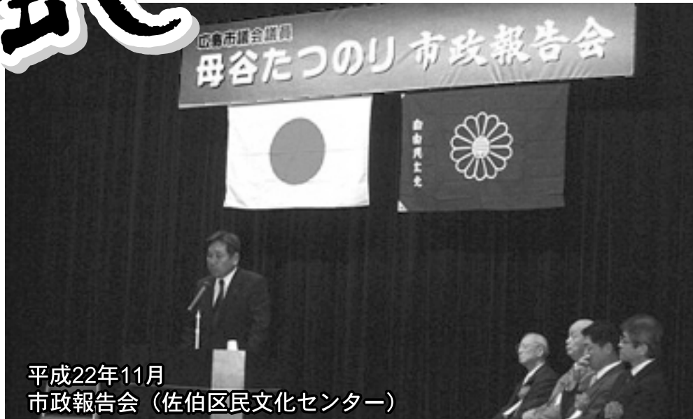
平成22年11月 市政報告会(佐伯区民文化センター)

また、名ばかりの議会基本条例が強引に可決されましたが、内容が不十分な上、全会一致とならなかつたため反対しました。現状の議会ではとんでもないことが次々に強権と数の横暴により議決されています。