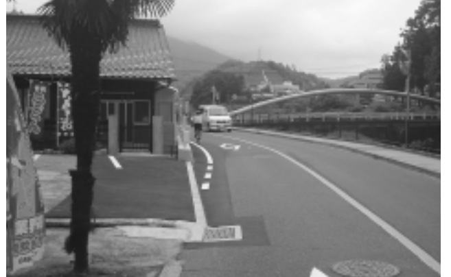
こんなに見通しがよくなりました