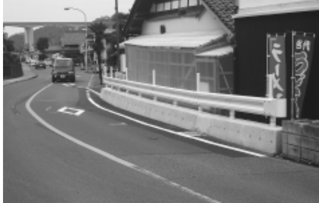
湯来方面から南側を臨む