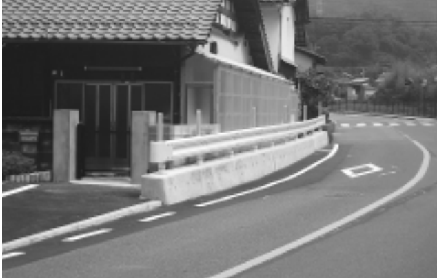
五日市方面から北側を臨む

この地区の官民境界線は昭和26年のルーヌ台風以降、現在の道路、河川の形状になるまでの間に登記訂正などが行われないうまま今日に至っていました。完成までには法的な問題を含め困難を極めました。多くの人の協力を得てこれで交通難所のひとつが解消されました。