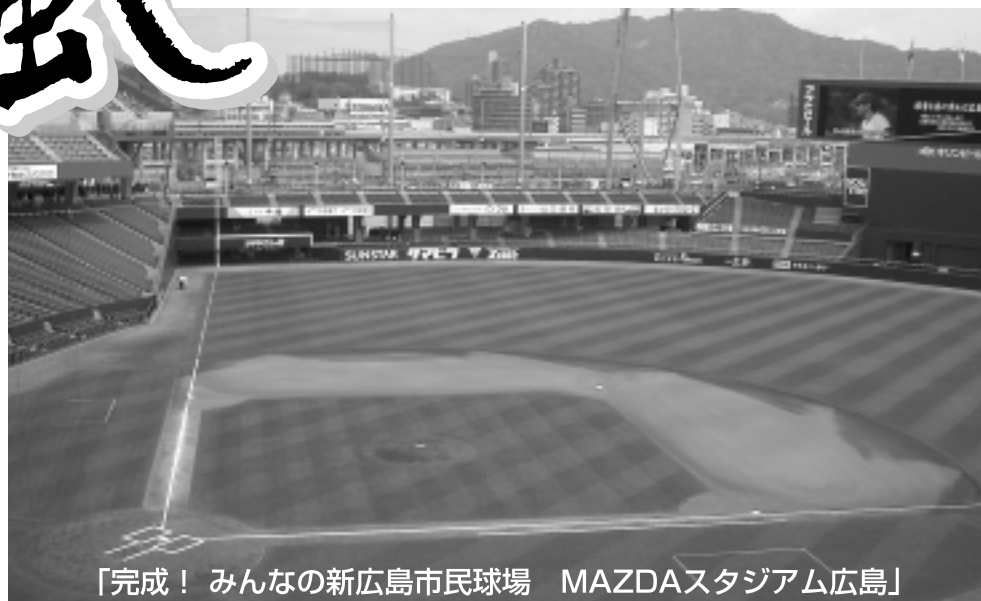
「完成！みんなの新広島市民球場 MAZDAスタジアム広島」