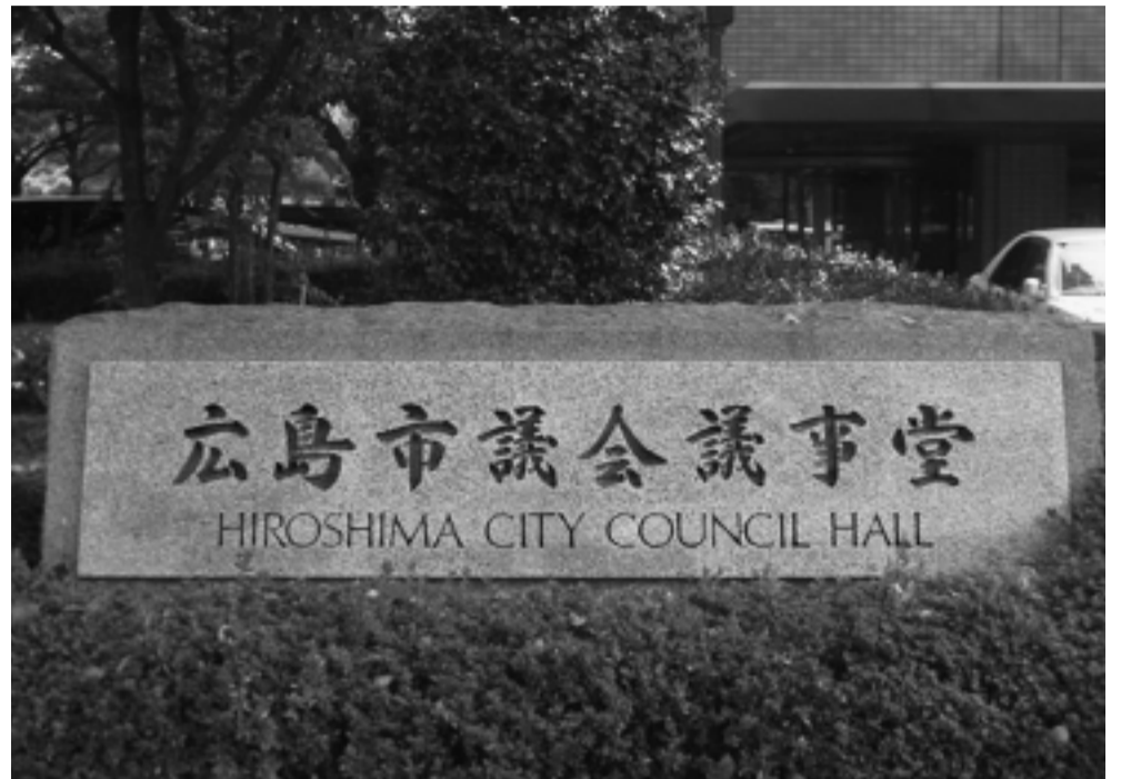
新たな市民の負託をうけた広島市議会