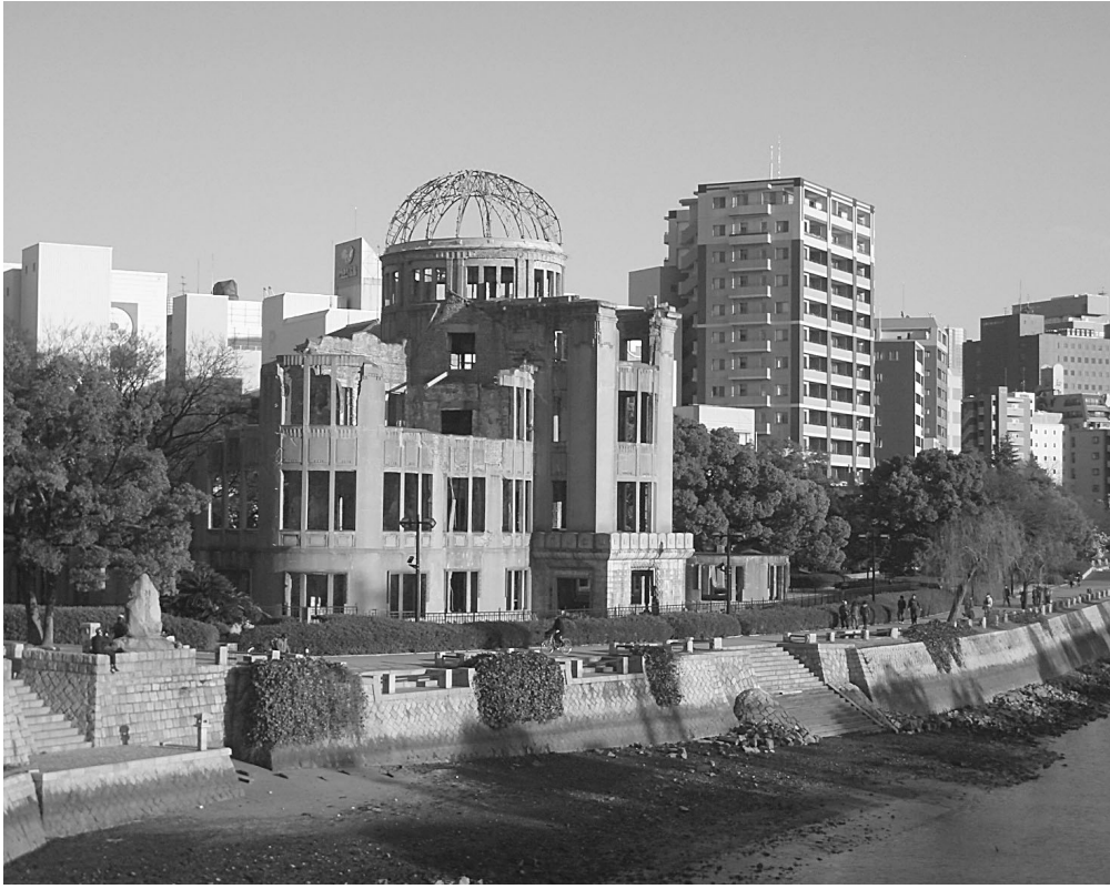
平和と核廃絶を訴えるだけの街でいいのでしょうか